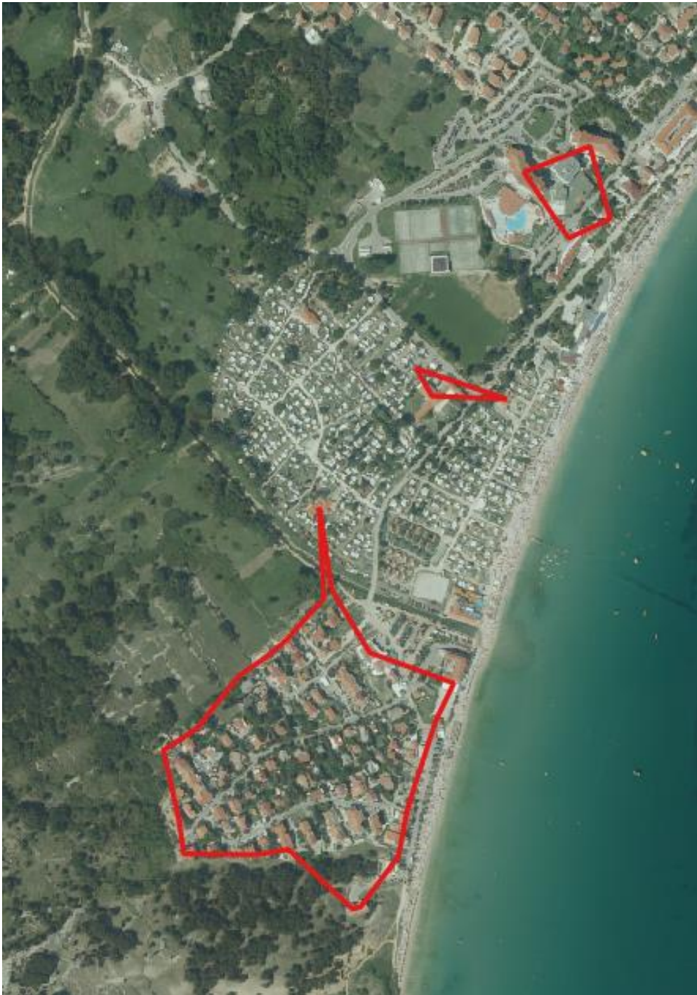
Prilog – Prikaz područja obuhvata svjetlovodne distribucijske mreže na karti